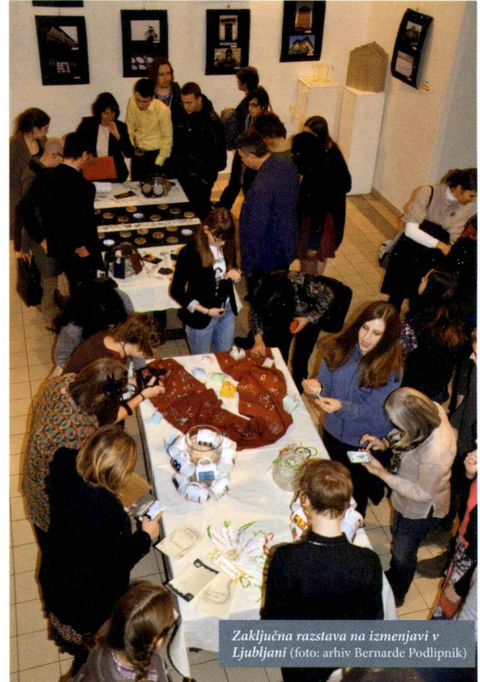
Zaključna razstava na izmenjavi v Ljubljani

Posebej dragocena izkušnja pri organizaciji izmenjave je bila neverjetna ustvarjalna zagnanost, ki je združila tako profesorje kot dijake in tudi nekdanje maturante naše gimnazije, saj so se številni prijazno odzvali in ponudili svojo pomoč pri organizaciji in izvedbi različnih delavnic. Dijaki so poskrbeli za celostno grafično podobo, pripravili fotografsko razstavo, glasbene nastope, literarne delavnice in recital, slikovito predstavili Slovenijo in šolo, bili so vodiči na ekskurzijah idr., predvsem pa prijazni gostitelji na svojih domovih in v dijaškem domu. Tako gostujoči dijaki kot profesorji so bili navdušeni nad našim zavodom in utripom življenja v njem, nad dijaško ustvarjalnostjo in odprtostjo, urejenostjo šole, organiziranostjo, predvsem pa nad gostoljubnostjo vseh – dejansko je bilo ves teden čutiti zelo prijetno razpoloženje, pripravljenost za delo, kreativno sodelovanje in medsebojno druženje. Zavedamo se, da imamo v zavodu res odlične prostorske in tehnične možnosti ter pogoje za tovrstne dejavnosti, a brez zaupanja in podpore vodstva zavoda ter brez tako strokovne kot osebne zavzetosti, pomoči in dobrohotne naklonjenosti