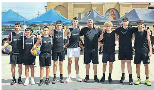
НАЈМЛАЂИ НА ТУРНИРУ: Екипе Бруцоши и Млади таленти