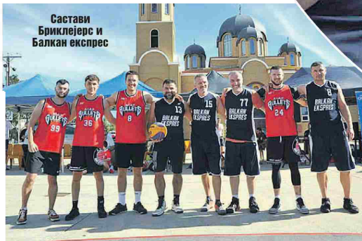
Састави Бриклејерс и Балкан експрес

Као и у претходним издањима, поново је било креативних назива екипа, па су уз традиционалне учеснице - Шмекери и Балкан експрес, учествовали Донбас, Маса је мама, Кум Дончић, Хракини змајеви, Бриклејерс, Бруцоши, Нови Сад и Млади таленти