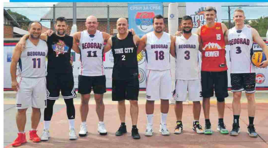
Кум Дончић и Хракини змајеви учи међусобног меча