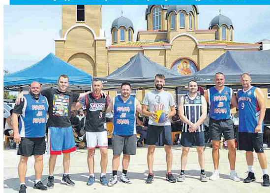
Екипе Маса је мама и Донбас