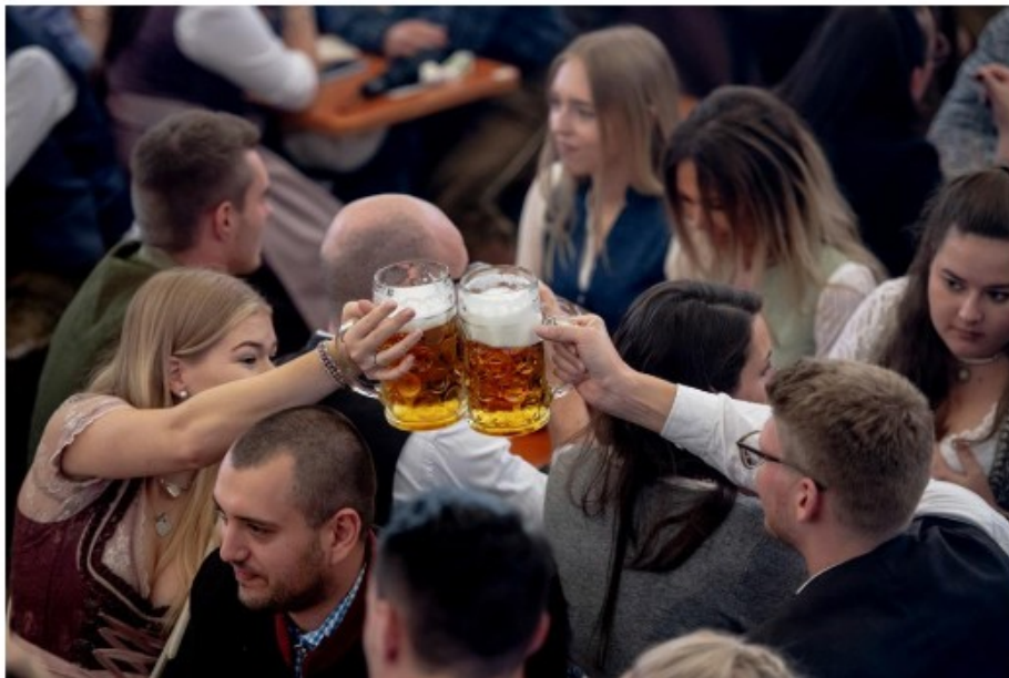
📷 Na Oktoberfestu po pijača spet dražja.

Tudi cene piva na Münchenskem slovitem festivalu Oktoberfest bodo letos še bolj narasle. V povprečju bodo višje za 6,12 odstotka. To pomeni, da bodo morali obiskovalci za litrski vrček priljubljene alkoholne pijače odšteti med 12,60 in 14,90 evra.