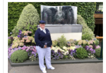
V sodniški opravi v Wimbledonu

Pot do sodnika (trenutno jih je v Sloveniji registriranih 73, od tega aktivnih pa četrtnina) vodi skozi nabiranje znanj: »Opraviti moraš tečaj v dveh delih za teniške sodnike, ki ga organizira Sodniška organizacija Teniške zveze Slovenije . Če tečaj uspešno opraviš, postaneš teniški sodnik in takoj lahko pričneš z delom na nacionalnih tekmovanjih, najprej na mladinskih, če se izkažeš, kmalu dobiš priložnost tudi na članskih in mednarodnih tekmovanjih nižjega ranga. Sigurno se največ naučiš, ko opazuješ druge bolj izkušene kolege in ko od njih prejmeš komentarje in priporočila. Novembra smo v sodniške vrste sprejeli pet novih sodnikov iz Posavja, na kar sem zelo ponosna in jim želim, da vztrajajo.«