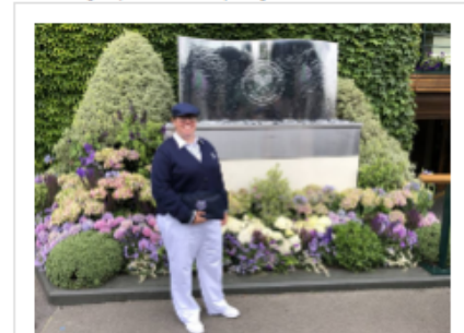
V sodniški opravi v Wimbledonu

Pot do sodnika (trenutno jih je v Sloveniji registriranih 73, od tega aktivnih pa četrtnina) vodi skozi nabiranje znanj: »Opraviti moraš tečaj v dveh delih za teniške sodnike, ki ga organizira Sodniška organizacija Teniške zveze Slovenije . Če tečaj uspešno opraviš, postaneš teniški sodnik in takoj lahko pričneš z delom na nacionalnih tekmovanjih, najprej na mladinskih, če se izkažeš, kmalu dobiš priložnost tudi na članskih in mednarodnih tekmovanjih nižjega ranga. Sigurno se največ naučiš, ko opazuješ druge bolj izkušene kolege in ko od njih prejmeš komentarje in priporočila. Novembra smo v sodniške vrste sprejeli pet novih sodnikov iz Posavja, na kar sem zelo ponosna in jim želim, da vztrajajo.«