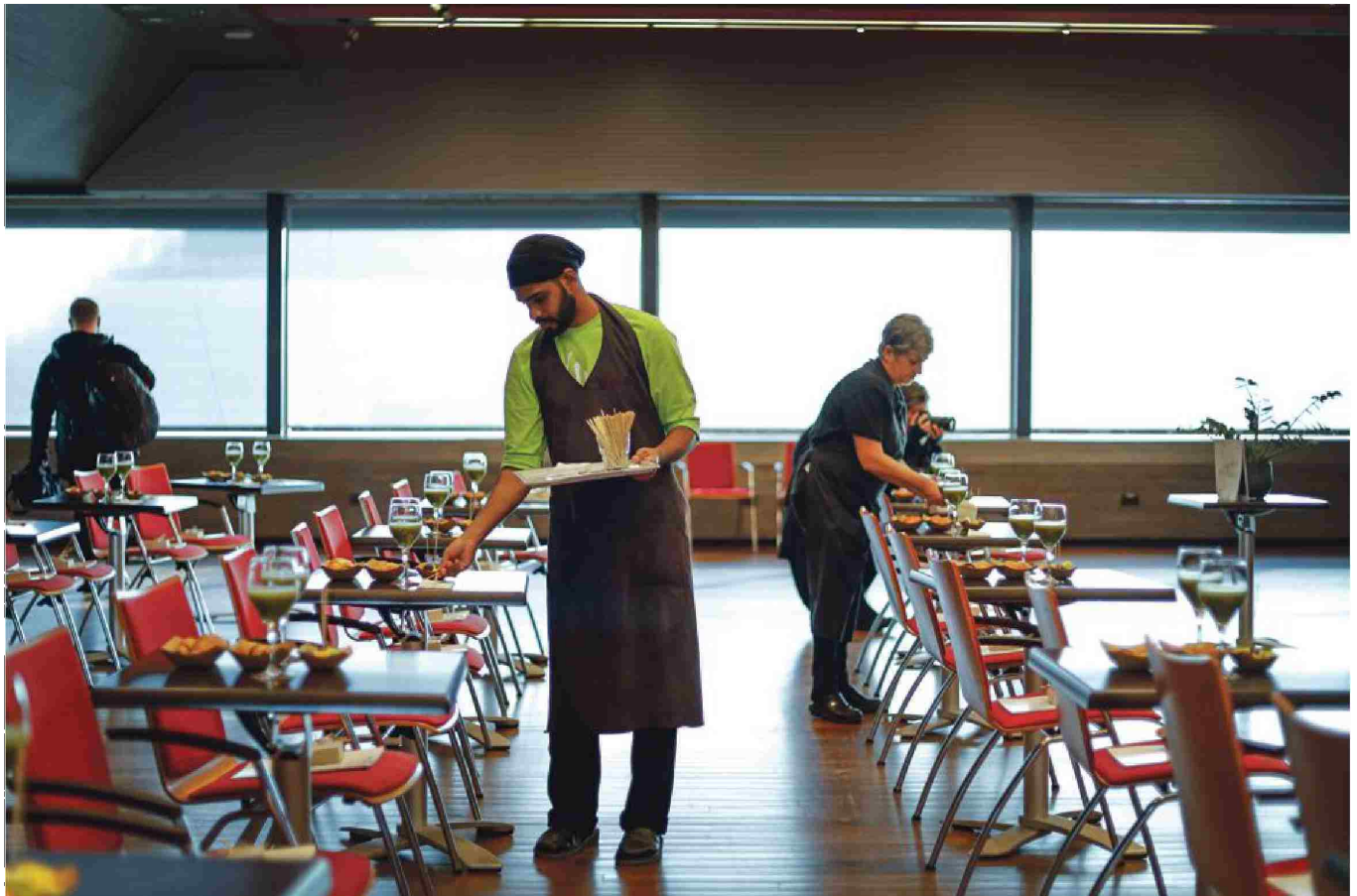
Povprečna plača v gostinstvu se je v zadnjih letih zvišala, a najnižja panožna osnovna plača je še vedno pod minimalno.