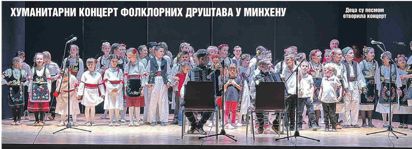
ХУМАНИТАРНИ КОНЦЕРТ ФОЛКЛОРНИХ ДРУШТАВА У МИНХЕНУ