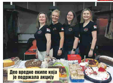
Део вредне екипе која је подржала акцију

црта била је заједнички изведена кореографија "Игре из Владичиног Хана" коју су пред публиком приказали сви фолклорни ансамбли. Треба напоменути да су посетиоци имали прилику да на једном штанду испробају специјалитете наше кухиње, што је било посебно интересантно за децу и најмлађе игра-