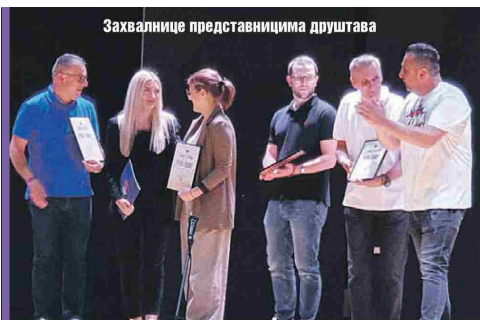
Захвалнице представницима друштава

црта била је заједнички изведена кореографија "Игре из Владичиног Хана" коју су пред публиком приказали сви фолклорни ансамбли. Треба напоменути да су посетиоци имали прилику да на једном штанду испробају специјалитете наше кухиње, што је било посебно интересантно за децу и најмлађе игра-