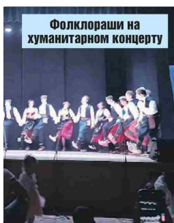
Фолклораши на хуманитарном концерту

Услови живота у кућерку су такви да деца маштају о кућици са собама, креветима, купатилом. Хуманитарна организација Срби за Србе покренула је акцију да се овој породици сагради кућа у којој би могли нормално да живе. И долазак њихових представника у Минхен на хуманитарни концерт минхенских фолклорних друштава и организовање акције "Тројка из блока" део је тих напора да се у акцију укључи што већи број хуманих појединаца и организација.