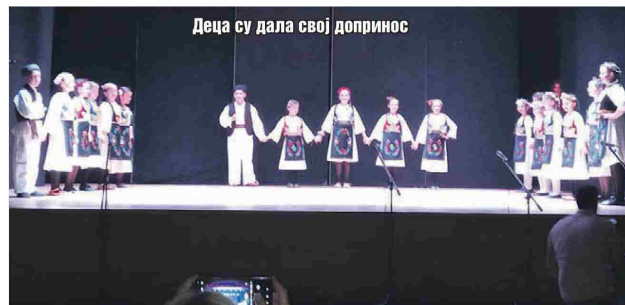
Деца су дала свој допринос