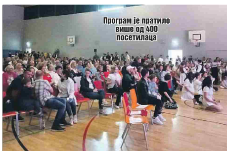
Програм је пратило више од 400 посетилаца

церте фолклорних друштава. Зарада од продате хране и пића део је укупног износа сакупљеног на концерту. Б. МИЛИЧИЋ