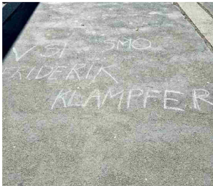
Z delavcem v stiski se nista bila pripravljena pogovoriti ne dekan ne rektor , vse je potekalo sterilno, nihče si ni hotel osebno mazati rok.