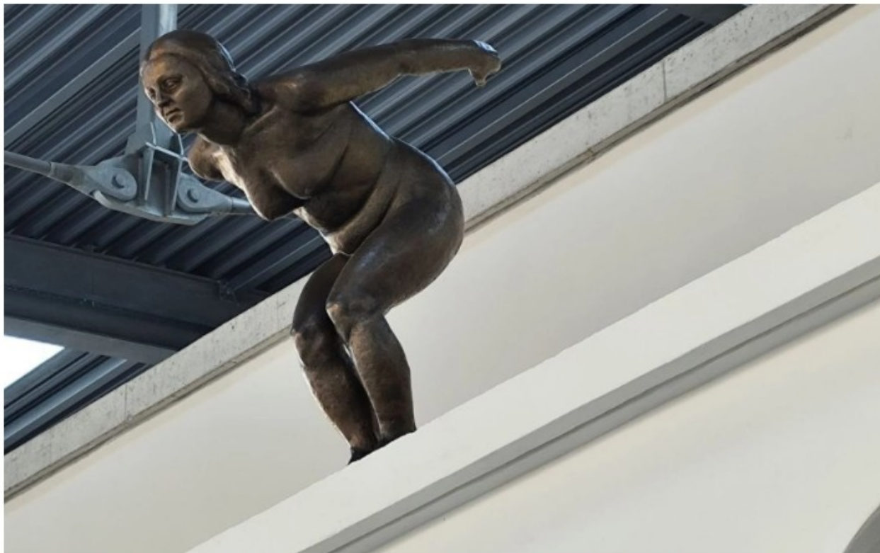
FOTO: Gola Plavalka že krasi vhod v Ilirijo: Kiparjema so pozirale te slovenske plavalke

Plavalka je krasila Ilirijo med leti 1942 in 2007, zdaj so postavili repliko, za modele so bile slovenske plavalke iz plavalnega kluba Ilirija.