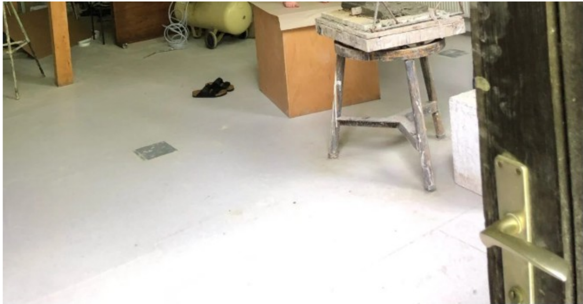
Za model so bile tri slovenske plavalke.