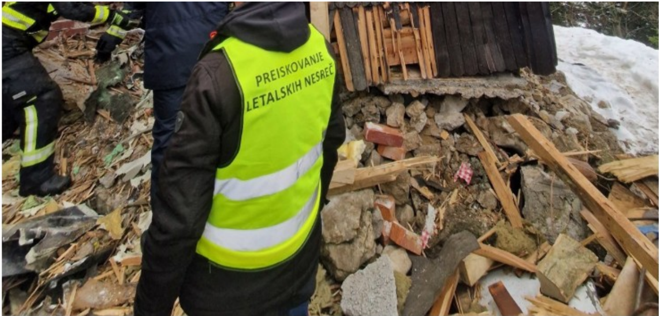
Posledica trčenja letala na Veliki planini

Po neuradnih informacijah portala NI naj bi bile v zgodnjih popoldanskih urah reševalne ekipe prišle do trupla pilota letala, ki je včeraj zjutraj poletelo iz Zagreba in je bilo na poti v Švico. Slovenska kontrola zračnega prometa je včeraj okoli 9.30 izgubila stik z letalom, ki je bilo takrat na območju Velike planine.