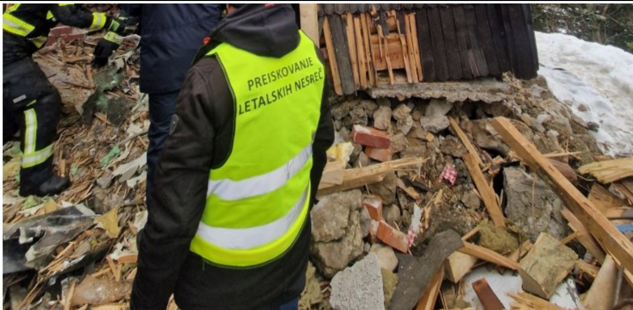
Posledica trčenja letala na Veliki planini

Po neuradnih informacijah portala NI naj bi bile v zgodnjih popoldanskih urah reševalne ekipe prišle do trupla pilota letala, ki je včeraj zjutraj poletelo iz Zagreba in je bilo na poti v Švico. Slovenska kontrola zračnega prometa je včeraj okoli 9.30 izgubila stik z letalom, ki je bilo takrat na območju Velike planine.