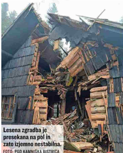
Lesena zgradba je presekana na pol in zato izjemno nestabilna.