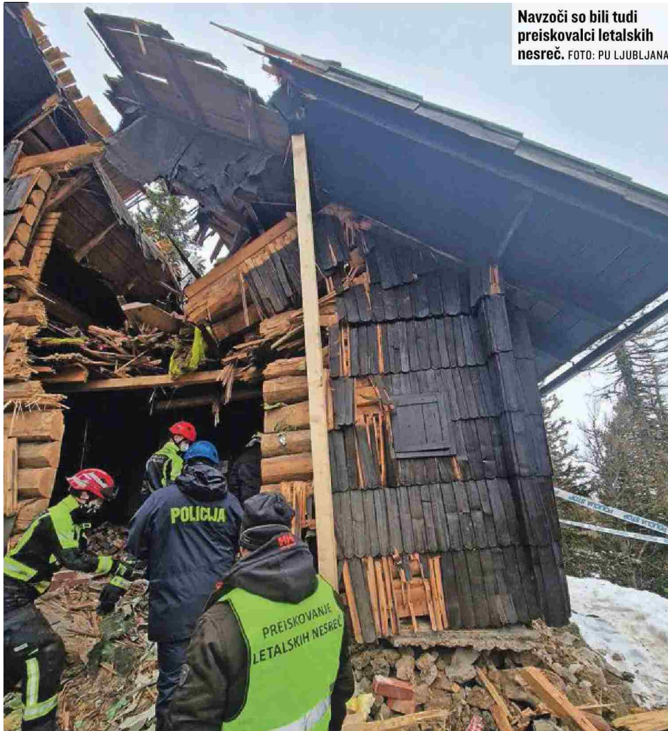
Navzoči so bili tudi preiskovalci letalskih nesreč.