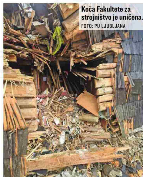
Koča Fakultete za strojništvo je uničena.