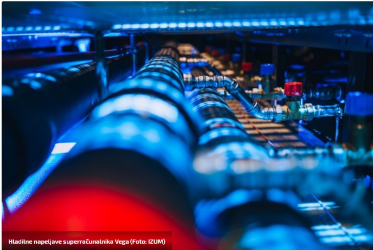
Hladilne napeljave superračunalnika Vega

Evropska komisija je objavila rezultate drugega roka razpisa za postavitev tovarn umetne inteligence, za katerega se že ve, da je bil uspešen tudi za Slovenijo, ki bo iz proračuna EU prejela 67,5 milijona evrov. Prej izbranim sedmim lokacijam se poleg Slovenije pridružujejo še Avstrija, Bolgarija, Francija, Nemčija in Poljska, so sporočili.