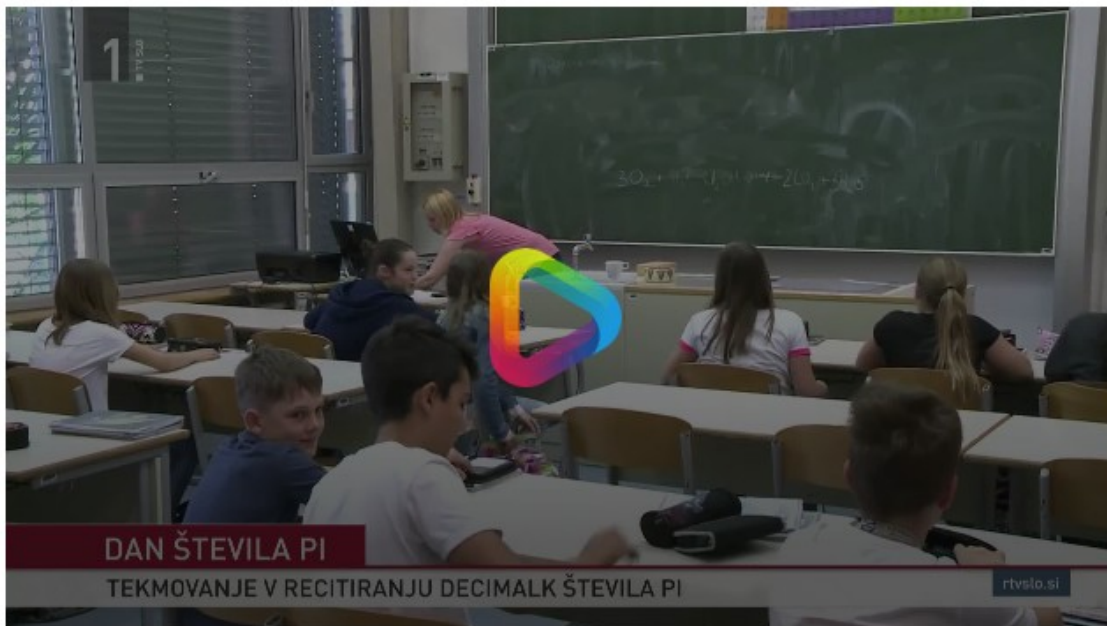
📺 Dan števila pi

Dan, ki je posvečen številu pi in na katerega se je leta 1897 rodil tudi znanstvenik Albert Einstein, leta 2018 pa umrl teoretični fizik Stephen Hawking, danes na pobudo mednarodne organizacije Unesco in največjega svetovnega matematičnega združenja IMU (International Mathematical Union) velja tudi za mednarodni dan matematike. Letošnja tema mednarodnega dneva matematike je Matematika, umetnost in kreativnost. Praznovanju se tudi letos pridružuje Društvo matematikov, fizikov in astronomov Slovenije z izvedbo likovnega natečaja.