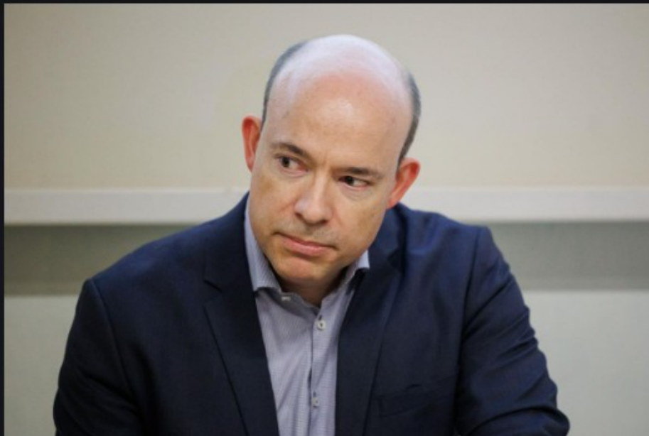
Philipp W. Stockhammer je dobitnik ERC Starting grant in leta 2020 ERC Consolidator grant.

Stockhammerjevo raziskovalno delo se osredotoča na transformativno moč medkulturnih srečanj, socialnih praks ter integracijo arheoloških in naravoslovnih podatkov pri proučevanju socialne pripadnosti, mobilnosti, hrane in zdravja.