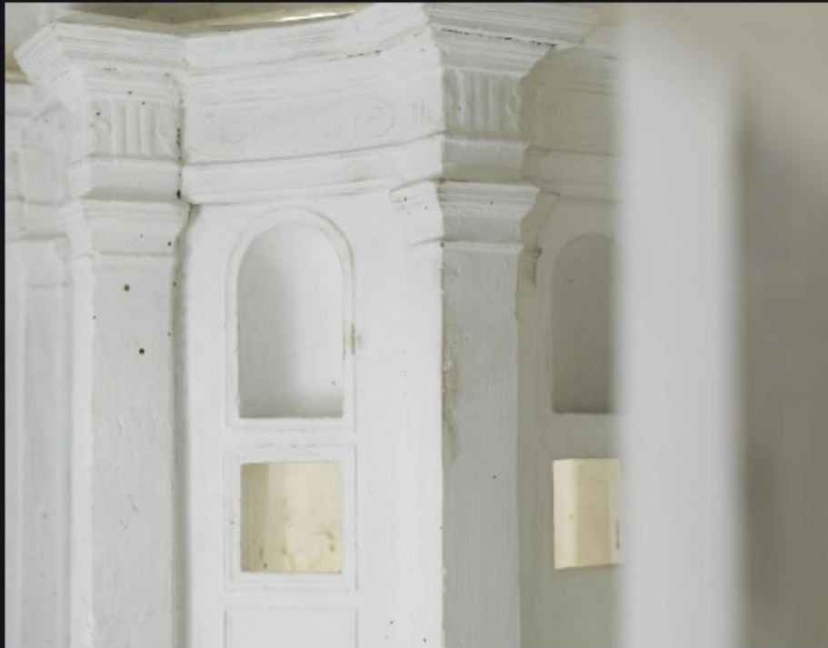
📷 Detajl modela – v notranjosti je jasno razvidna zasnova notranjščine cerkve.