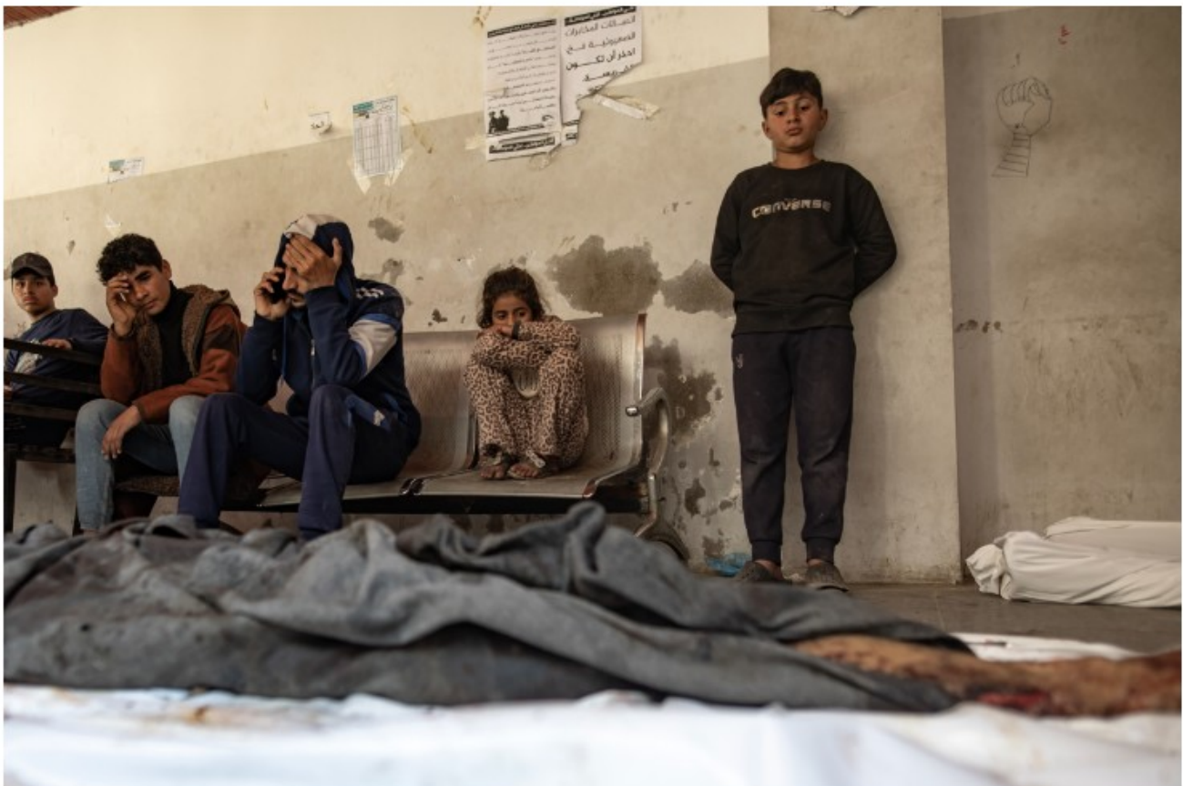
Palestinci žalujejo ob truplih sorodnikov v Baptistični bolnišnici v Gazi, marec 2025